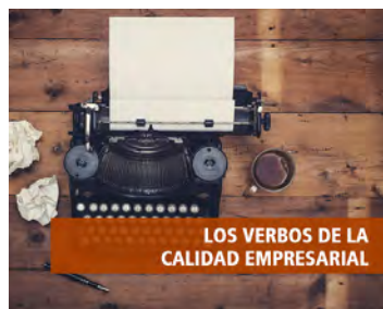
LOS VERBOS DE LA CALIDAD EMPRESARIAL

Entender y aprender es un proceso vivencial por el que, alejados de nuestra zona de confort, podemos proyectarnos como persona y como profesional de una forma que tenemos olvidada en la rutina de nuestro día a día.