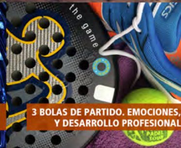
3 BOLAS DE PARTIDO. EMOCIONES, Y DESARROLLO PROFESIONAL