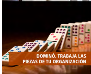
DOMINÓ. TRABAJA LAS PIEZAS DE TU ORGANIZACIÓN