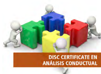
DISC CERTIFICATE EN ANÁLISIS CONDUCTUAL

El coaching centrado en los procesos de liderazgo es una estrategia de desarrollo de urgente tratamiento que ayuda a que el equipo comprenda todas las fases y se involucre en hacer que éstas se cumplan con éxito.