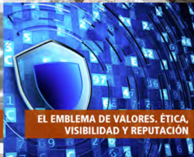
EL EMBLEMA DE VALORES. ÉTICA, VISIBILIDAD Y REPUTACIÓN