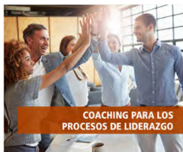
COACHING PARA LOS PROCESOS DE LIDERAZGO

Igualmente es esencial, tanto para el éxito de nuestras aportaciones como para los resultados en tu organización cuando las aplicas, implementar desde el primero momento y en tiempo real los conocimientos adquiridos para enfilar la vía de búsqueda de los hitos determinantes en tu negocio: la productividad y la rentabilidad . Diseñamos nuestros enfoques para que tengas tus puntos de activación.