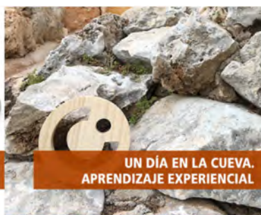
UN DÍA EN LA CUEVA. APRENDIZAJE EXPERIENCIAL