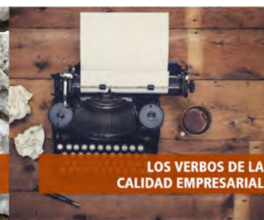
LOS VERBOS DE LA CALIDAD EMPRESARIAL