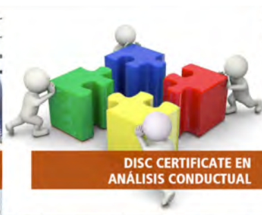
DISC CERTIFICATE EN ANÁLISIS CONDUCTUAL