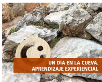
UN DÍA EN LA CUEVA. APRENDIZAJE EXPERIENCIAL

No todos somos iguales, cada persona tiene unas habilidades y competencias que van arraigadas no a quién o qué somos sino a cómo somos y nos comportamos, de ahí la trascendencia de conocer los perfiles de tu empresa y su encaje en sus roles profesionales.