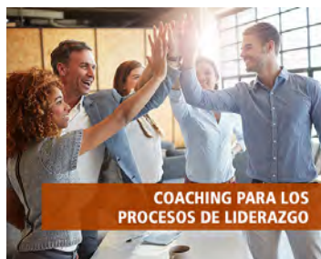
COACHING PARA LOS PROCESOS DE LIDERAZGO

Detectar tus necesidades e inquietudes es vislumbrar quién eres, cómo actúas y cuál es tu perspectiva. Tu visión de empresa es tu referente, tu reto, el faro que te guía y del que no puedes separarte si buscas proyección y permanencia en el tiempo. Queremos formar parte de tu desarrollo y para ello nos enfocamos en: